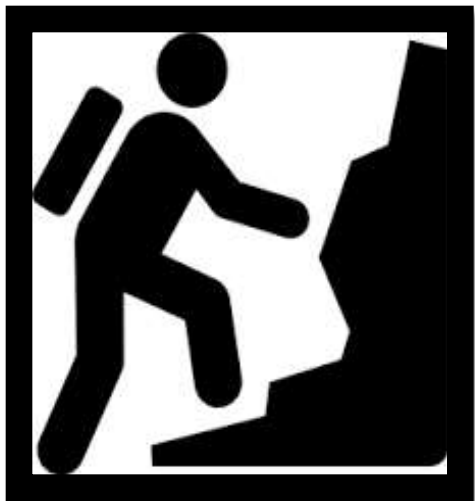
PLAN 1 雪山冒險家