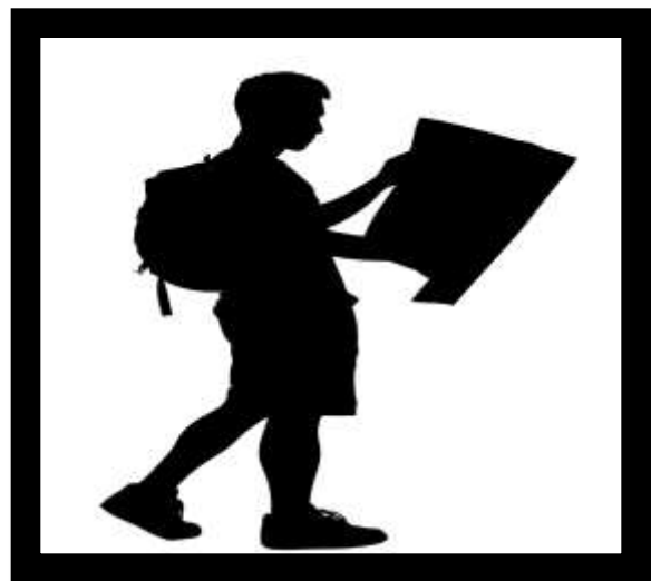
PLAN 3 冒險陣線聯盟