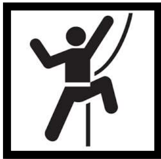
PLAN 2 我是冒險王